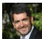
Jean Rottner Président de la FNAU Fédération Nationale des Agences d'Urbanisme