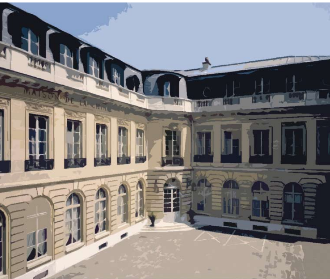
La Maison de la Chimie

Le grand rendez-vous annuel des acteurs communautaires se tient cette année à Paris. Avant les prochains renouvellements municipaux de mars 2008, la Convention vient ponctuer les sept années du mandat communautaire. Cette édition intervient de fait aux prémices d'une nouvelle législature, à un moment déterminant pour la définition des grands chantiers de réforme à venir.