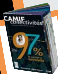
Le nouveau catalogue Collectivités

Retrouvez la charte et nos engagements sur www.camif-collectivites.fr ou téléphonez au 05 49 34 62 00