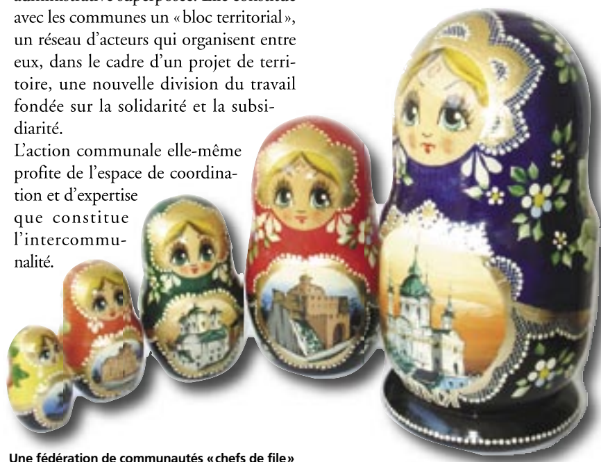
Une fédération de communautés « chefs de file »

C'est pour cela que nous sommes favorables à une grande souplesse dans les modes d'organisation des responsabilités entre communes et communautés. Nous proposons de recourir à la notion de « chef de file », inscrite dans notre Constitution, laissée actuellement en friche. La communauté doit pouvoir être « chef de file » sur les grandes politiques structurantes, en assurer le financement principal tout en ayant la possibilité d'en déléguer contractuellement, sur certains aspects, la mise en œuvre opérationnelle aux communes. Il est possible de combiner la cohérence des choix collectifs et la solidarité financière avec le maintien de la proximité communale dans le contact quotidien avec les habitants.