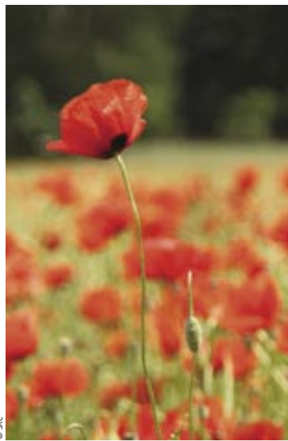
© SNC Pascal Vautier Président de la Fédération des Conservatoires d'espaces naturels

Les États généraux du Paysage, regroupant près de 500 personnes représentant plus de 200 organismes d'horizons divers, se sont déroulés le 8 février 2007 au Conseil économique et social à Paris, avec pour ambition de trouver des solutions nouvelles pour la création et la protection des paysages.