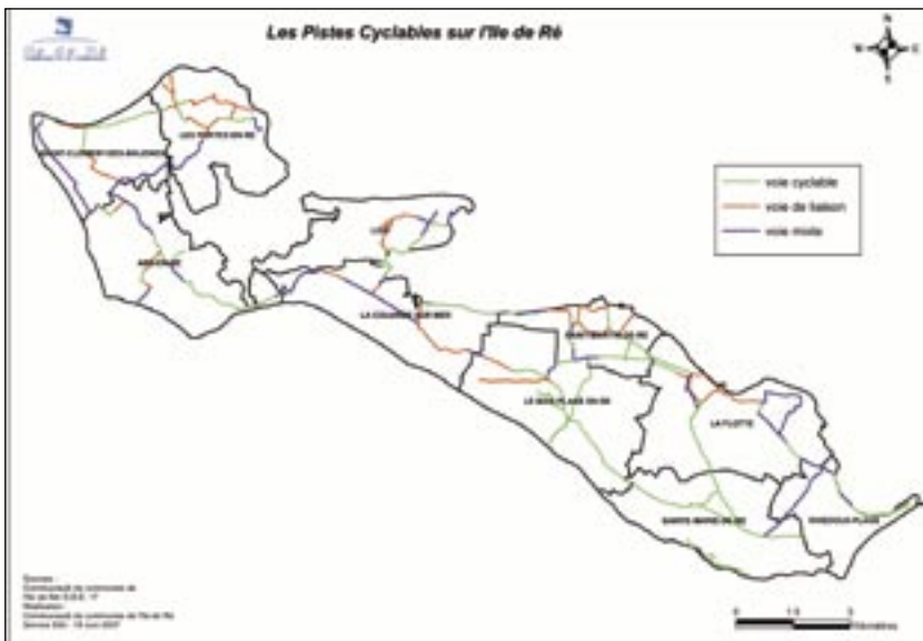
1. Guide Pratique 2007

découverte de l'ensemble de ces facettes permet de mieux appréhender ce territoire insulaire. ■