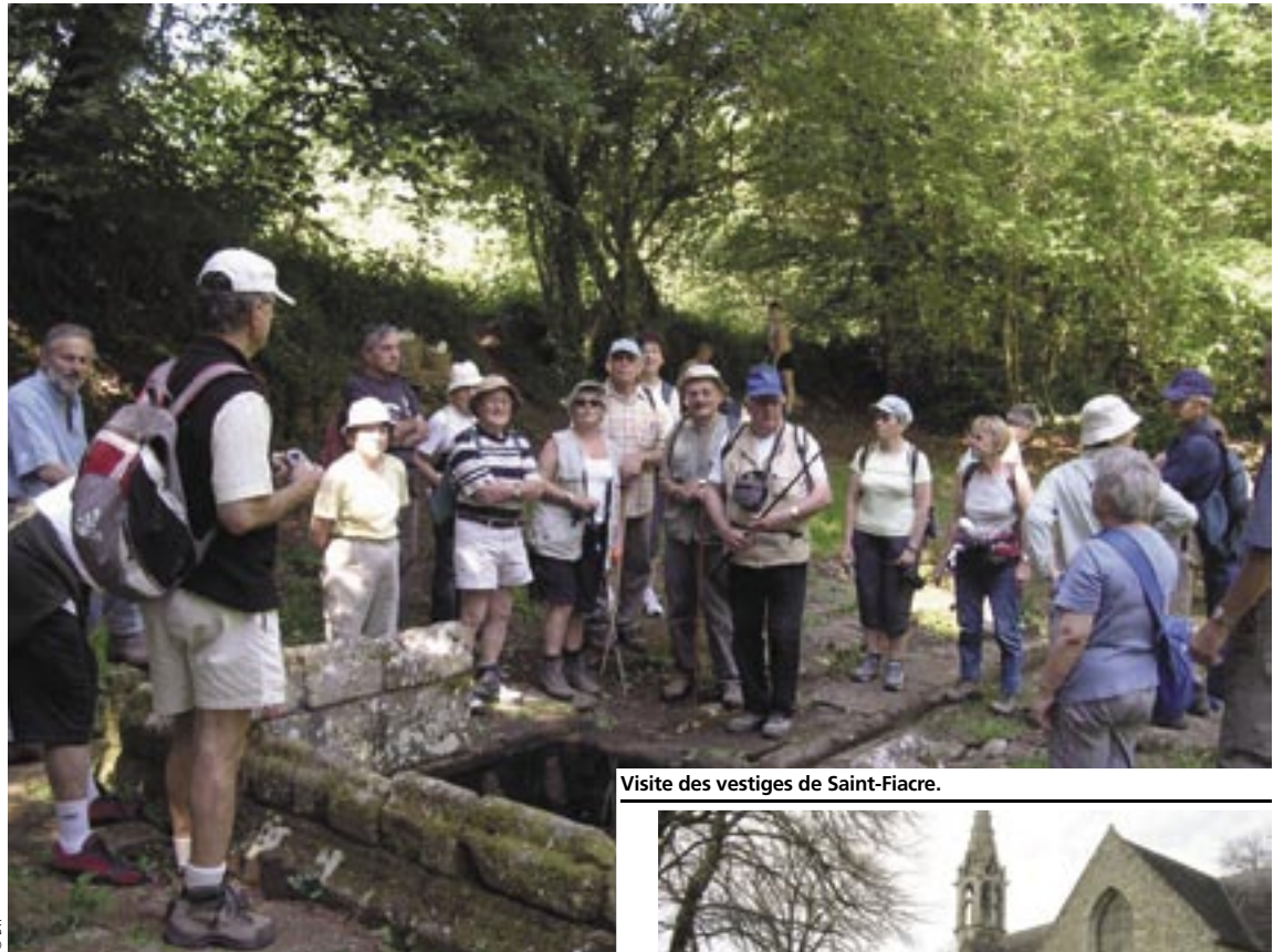
Visite des vestiges de Saint-Fiacre.

Outre l'appel au roi éponyme, la communauté a su s'appuyer, dans sa démarche de construction identitaire, sur la richesse de son patrimoine : des églises romanes de Langonnet, Ploërdut et Priziac aux édifices gothiques de Sainte Barbe et Saint Fiacre du Faouët, en passant par les vestiges du château des Rohan à Guémené sur Scorff, l'ensemble à de quoi séduire le voyageur amoureux des vieilles pierres. C'est d'ailleurs la nécessité de tirer davantage parti de cette extraordinaire richesse historique qui achève de convaincre le conseil communautaire de créer, en 2003, un office du tourisme