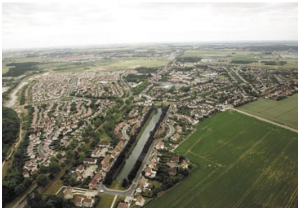
Un carré fédérateur pour créer un cœur de ville... autour d'un large canal.

Avec, aujourd'hui, 1 500 emplois et quelques 10 000 prévus « à terme » sur le « carré », Sénart est plus que confiant. « Nous comptons sur la mobilisation de tous les acteurs, en particulier l'association Sénart Développement, qui a vocation à porter tout le pôle emploi, développement économique et formation,