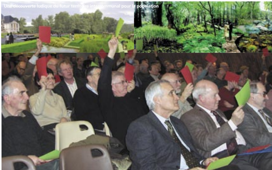
La communauté a testé la population sur ses connaissances en matière de patrimoine local.

Trois communautés de Normandie envisagent de fusionner, au 1 er janvier 2008. L'enjeu pour ce territoire est de se définir une identité propre, entre les deux pôles importants que sont Rouen et Le Havre, en créant un pôle d'équilibre intermédiaire autour de la zone d'emploi de Port-Jérôme. Un projet auquel la population est largement associée.