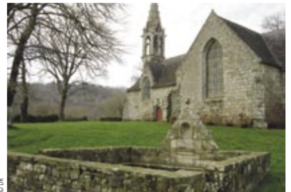
Chapelle de Saint-Urlo-Faouët.